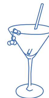
Wasabi cocktail Campari, jus d'ananas, gin, sirop lychee