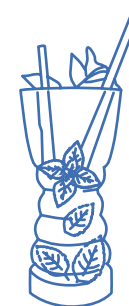
Mojito Feuille de menthe, citron vert, sucre de canne, rhum blanc