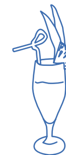
Piña colada Rhum, jus d'ananas, crème noix de coco