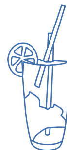
Caïpirinha Citron vert, cachaça, sucre de canne, glace